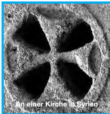
An einer Kirche in Syrien

Christliche Mitte Volksbank Lippstadt IBAN DE25416601240749700500 BIC GENODEM1LPS Postbank Dortmund IBAN DE41440100460013064461 BIC PBNKDEFF440 Vereinigung zum Schutz schwacher und hilfloser Menschen Volksbank Lippstadt IBAN DE11416601240759001500 BIC GENODEM1LPS