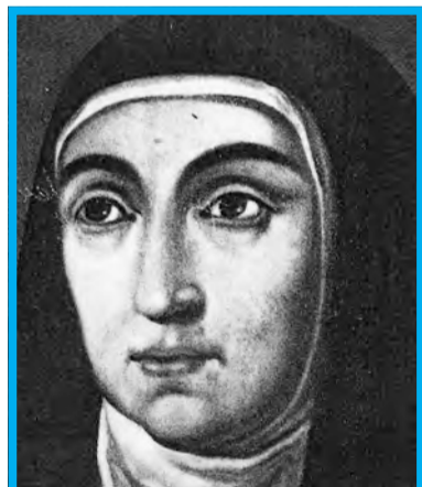
Teresa v. Avila (1515-82), Gründerin/Reformerin zahlreicher Klöster, Gebets-Lehrerin: „Gott allein genügt.“

Verpartnerung bleibt unfruchtbar, jedenfalls im Hinblick auf Kinder. Deshalb ist es sprachlicher Betrug, von „Ehe“ zwischen Homosexuellen zu reden. Auch ahnungslose Christen gebrauchen diesen verwirren Begriff. Ein Land, das „Ehe“ vortäuscht, darf langfristig nicht über fehlende Früchte klagen. Das CM-Faltblatt schützt Jugendliche.