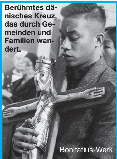
Berühmtes dänisches Kreuz, das durch Gemeinden und Familien wandert. Bonifatius-Werk

errichten, dazu ein Pilgerheim und ein Krankenhaus. 614 zerstören Perser die Bauten. Als 637 Muslime Jerusalem besetzen, 5 Jahre nach dem Tod Mohammeds, errichten sie ihre Gebäude, auch um Abraham besser vereinnahmen zu können. Sr. Anja Näheres über den Tempelberg und die politischen, religiösen, kulturellen und historischen Konflikte im aktuell-spannenden Erzählbuch „Die Reise nach Jerusalem“/178 S.) gegen beliebige Spende zugunsten obdachloser Familien.