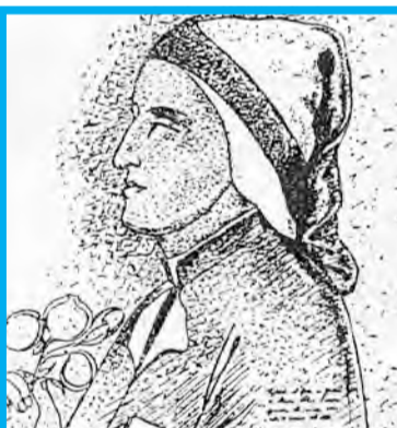
Dante Alighieri (geb. 1265), der bedeutendste italienische Dichter. Seine „Göttliche Komödie“ ist 600mal ins Deutsche übersetzt worden.

Die 600 Piuspriester in 32 Ländern haben 220 Theologiestudenten, mehr als 100 Ordensbrüder und 165 Schwestern, etwa 80 Oblatinnen-Schwwestern und zahlreiche befreundete Priester. Sie arbeiten in 100 eigenen Schulen, 20 Exerzitienhäusern und sind freundschaftlich mit 25 Ordensgemeinschaften verbunden.