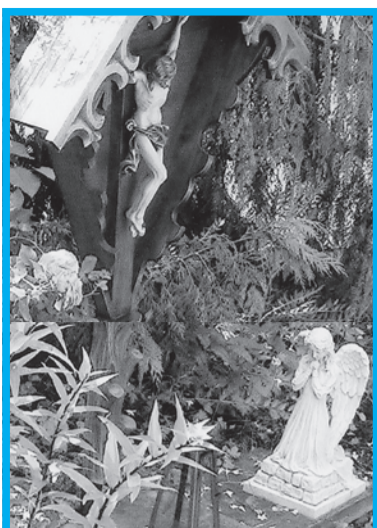
Gekreuzigter, DU bist im Licht, und DU vergisst auch unser nicht.

Christliche Mitte Volksbank Lippstadt IBAN DE25416601240749700500 BIC GENODEM1LPS Postbank Dortmund IBAN DE41440100460013064461 BIC PBNKDEFF440 Vereinigung zum Schutz schwacher und hilfloser Menschen Volksbank Lippstadt IBAN DE11416601240759001500 BIC GENODEM1LPS